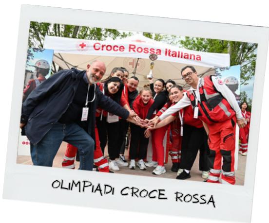
OLIMPIADI CROCE ROSSA