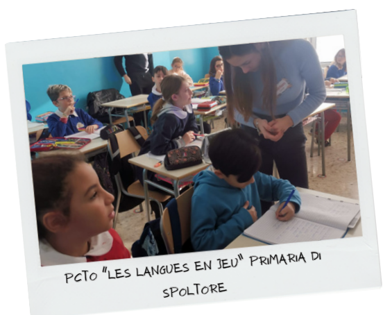
PCTO "LES LANGUES EN JEU" PRIMARIA DI SPOLTORE