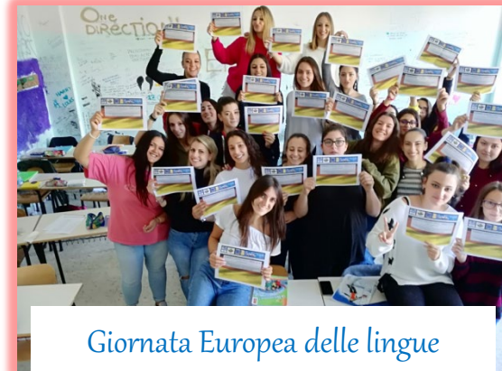
Giornata Europea delle lingue