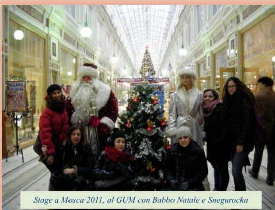
Stage a Mosca 2011, al GUM con Babbo Natale e Snegurocka