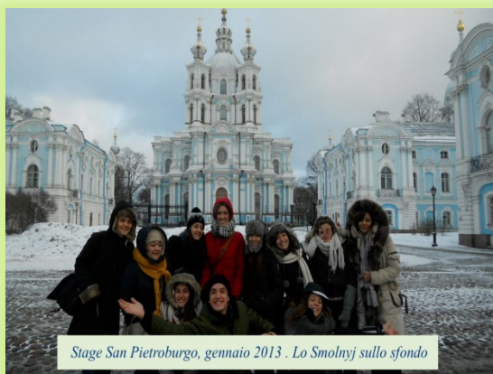
Stage San Pietroburgo, gennaio 2013 . Lo Smolnyj sullo sfondo