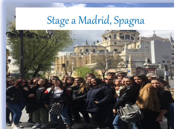
Stage a Madrid, Spagna