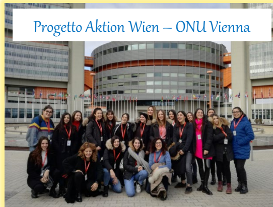
Progetto Aktion Wien – ONU Vienna